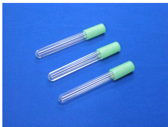
◆専用キャップ(別売・5色)もございます◆